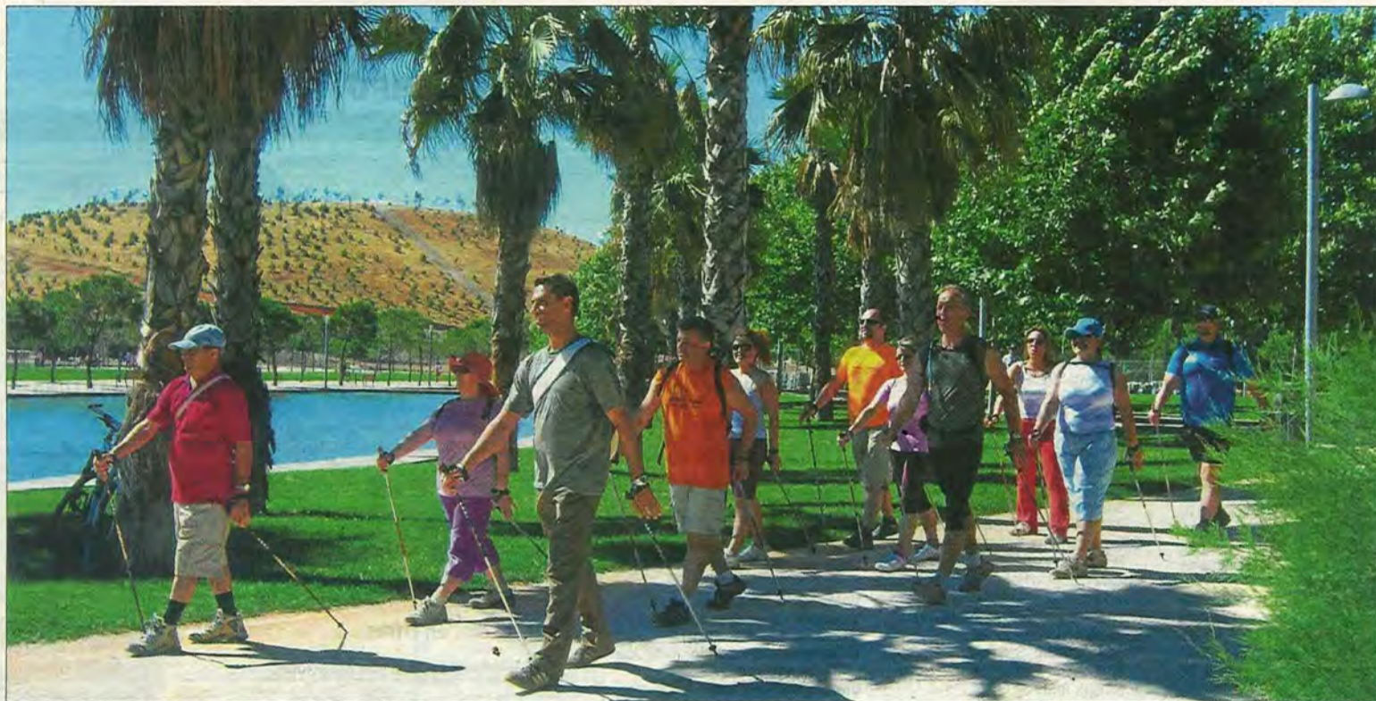
Un grupo de personas practica el 'nordic walking' o marcha nórdica en el Parque Sur de Madrid.